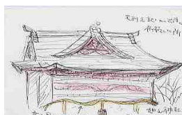
龍のしめ縄が印象的な旭山神社

説明の合間にちょっと目をそらして見ると、思わぬ発見もあり、私は素描スケッチをして自分なりに「西国街道」を堪能(かんのう)した一日でした。