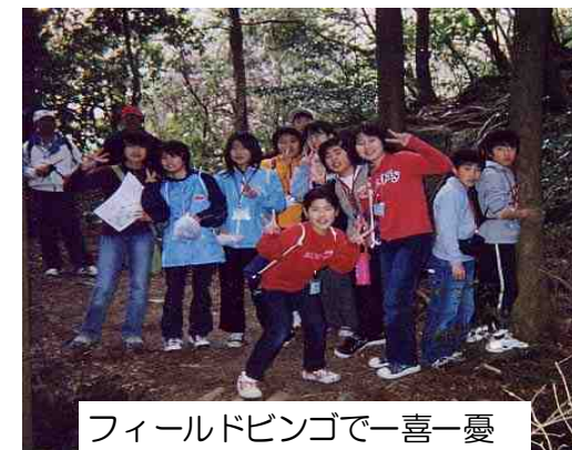
フィールドビンゴで一喜一憂

西区子ども会連合会の主要行事のひとつになっている西区年少リーダー研修会は、学区内の年少リーダーが単位子ども会のリーダーとして活動できるよう自覚をうながし、その資質の向上を図るために行っており、今回の研修会は一年間の集大成となるものでした。